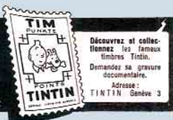
L'Echo illustré - L'Echo magazine

Deux numéros en hommage à Hergé: le 11 avril 1996 et le 27 février 2003. Ci-contre, une publicité pour des timbres portant l'effigie de Tim (Tintin) parue dans L'Echo illustré du 28 avril 1956.