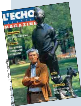
L'Echo illustré - L'Echo magazine