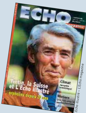
L'Echo illustré - L'Echo magazine