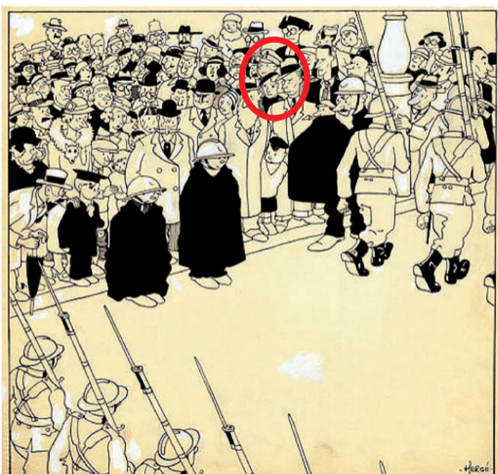
AUTOCARICATURE Quick et Flupke 1933: dans ce gag, Hergé se dessine avec chapeau, aux côtés de sa première épouse et de son frère.

Le seul film de l'expo sort des archives de la TSR. Jean-Jacques Lagrange interviewe Hergé en 1960, l'année de Tintin au Tibet , pour le compte de Continents sans visa . Quinze minutes qui s'achèvent par un dessin du maître en direct.